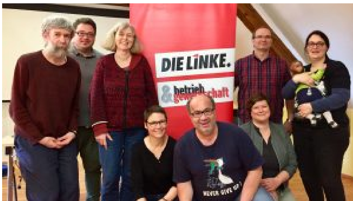
Bundessprecher/innen-Rat der AG Betrieb & Gewerkschaft